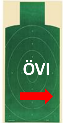
Wegweiser ab Brünigpass

Verschiebungszeit Interlaken – Tschorren: 35 Minuten (10 mehr als Affenwald)